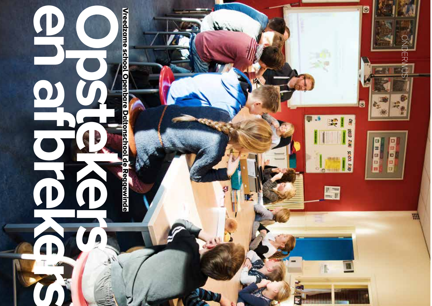
Vreedzame school Openbare Daltonschool de Reggewinde